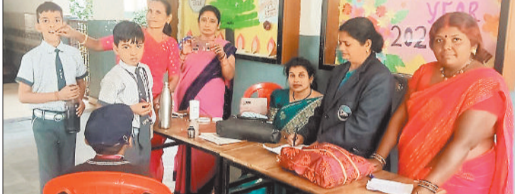
हरिभूमि न्यूज ►► चांपा