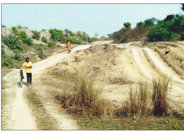
कच्ची मार्ग से होकर गुजरते लोग

कुरदा से कुदरी बैराज तक सड़क निर्माण का काम 16 साल बाद भी पूरा नहीं हो पाया है। कुदरी बैराज पर्यटन स्थल के रूप में होने से इस मार्ग से लोगों का आवागमन निरंतर बनी रहती है। पिकनिक मनाने एवं घूमने के लिए काफी संख्या में लोग इस मार्ग से आना जाना करते हैं, लेकिन आधा अधूरा निर्माण कार्य होने से लोगों को आवाजाही में परेशानी हो रही है। इस मार्ग में अधूरा सड़क निर्माण का कार्य पूर्ण होने से जहां लोगों को आवागमन करने के लिए काफी सुविधाएं होंगी, तो वहीं दूसरी ओर ट्रैफिक की समस्याओं से भी लोगों को राहत मिलेगी।