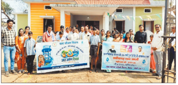
लोगों को जागरूक करते अफसर एवं ग्रामीण।