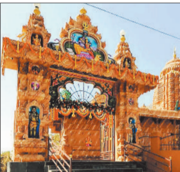
हरिभूमि न्यूज ►► जांजगीर-चांपा

सक्ती जिला के ग्राम जमड़ी के महाकाल मंदिर में महाशिवरात्रि के अवसर पर रविवार 15 फरवरी से गुरुवार 19 फरवरी तक पांच दिवसीय मेला आयोजित किया जाएगा। इस वर्ष यह पांचवां आयोजन है जिसमें हजारों श्रद्धालुओं के पहुंचने की संभावना है। मेला है कि जमड़ी के शुक्ला परिवार द्वारा