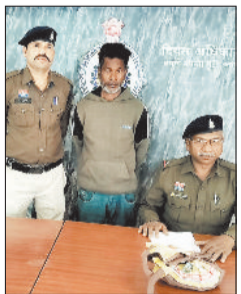
जबका गांजा के साथ आरोपी।

बिरयानी सेंटर में अवैध रूप से गांजा की तस्करी मामले में पुलिस ने आरोपी को गिरफ्तार कर लिया है। साथ ही आरोपी के कब्जे से 495 ग्राम गांजा जब्त किया गया है। मामला सक्ती थाना क्षेत्र का है।