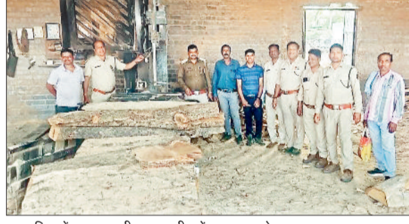
आरा मिल में जब लकड़ी तथा मशीन में ताला लगाते अफसर।