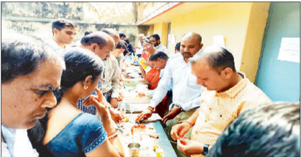
कार्यशाला में उपस्थित विज्ञान शिक्षक।

राष्ट्रीय विज्ञान दिवस 28 के अवसर पर आयोजित होने वाले विज्ञान मेले की तैयारियों को लेकर वीआरसीसी भवन में विज्ञान शिक्षकों की दो चरणों में कार्यशाला वीआरसी भवन